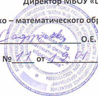
ГРАФИК ПРИЕМА ДОКУМЕНТОВ В 1 КЛАСС