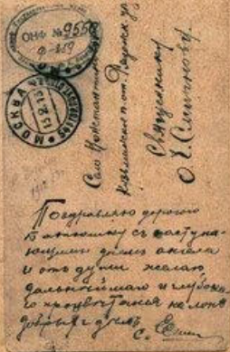
Открытка с автографом поэта С.А.Есенина И.Я. Смирнову 1913 год.