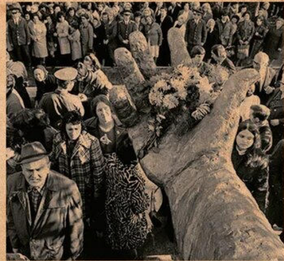
Открытие памятника Есенину, 1975 г.