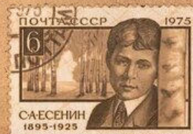
Почтовая марка «80 лет со дня рождения С.А. Есенина (1895-1925)»